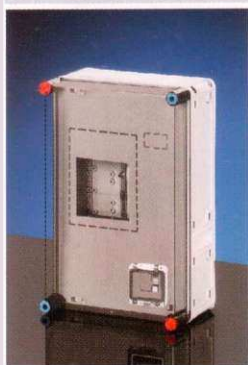
300x450 mm Basic 3fm cikksz.: HB 3000 egy- vagy háromfázisú fogyasztás- mérőhöz és kismegszakítókhoz, beépítési mélység: max. 146 mm Listaár: 14 995 Ft+ÁFA