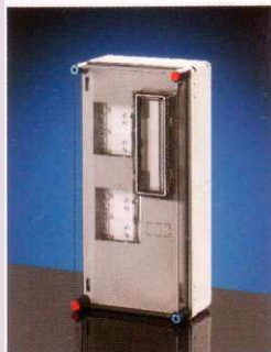
300x600 mm Basic 11fmK-A cikksz.: HB11KA mérőkombináció 2 egyfázisú fogyasztás- mérő, hangfrekvenciás vevő (ELMŰ, ÉMÁSZ) vagy rádiófrekvenciás vevő (EON) számára, fővezeteki sorkapocs nélkül, beépítési mélység: max. 146 mm Listaár: 21 823 Ft+ÁFA