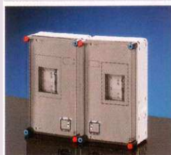
600x450 mm Basic 33fmK cikksz.: B33K0 mérőkombináció általános és vezérelt fogyasztásmérő és vezérlőkészülékek számára, 2x3, vagy 2x1 fázisú alkalmazásra, fővezeteki sorkapocs nélkül, beépítési mélység: max. 146 mm Listaár: 34 754 Ft+ÁFA