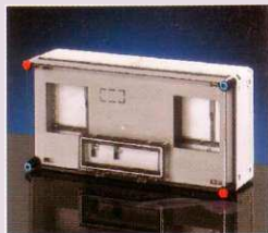
600x300 mm Basic 11fmK-F cikksz.: HB11KF mérőkombináció 2 egyfázisú fogyasztás- mérő, hangfrekvenciás vevő (ELMŰ, ÉMÁSZ) vagy rádiófrekvenciás vevő (EON) számára, fővezeteki sorkapocs nélkül, beépítési mélység: max. 146 mm Listaár: 21 823 Ft+ÁFA