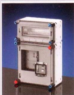
300x450 mm Basic 1fm 12 cikksz.: B1012 egyfázisú mérő számára, beépítési mélység: max. 146 mm levehető fedéllel, kismegszakító szekrényel, 1 soros, 12 osztásegység (12x18 mm), N- és PE kapocsok nélkül Listaár: 21 934 Ft+ÁFA